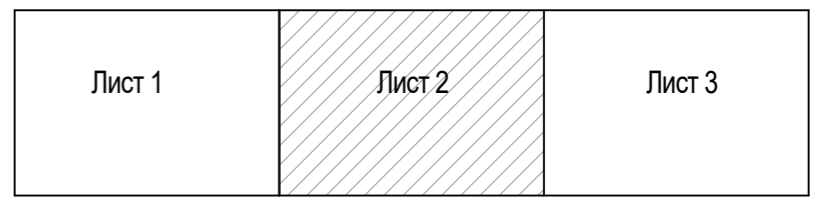
СХЕМА КОМПОНОВКИ ЛИСТОВ

Топографическая съемка предоставлена Заказчиком Система координат МСК-02 Система высот Балтийская Сплошные горизонтали проведены через 0,5 м