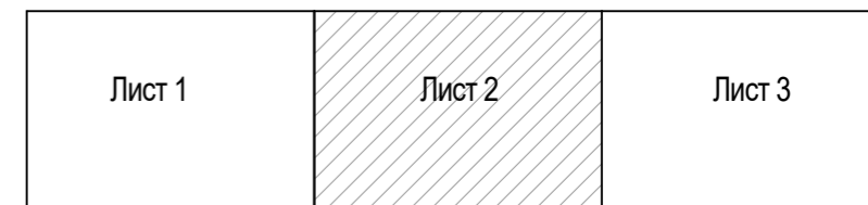
СХЕМА КОМПОНОВКИ ЛИСТОВ

Топографическая съемка предоставлена Заказчиком Система координат МСК-02 Система высот Балтийская Сплошные горизонтали проведены через 0,5 м